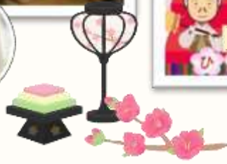
似顔絵 5段ひな飾り