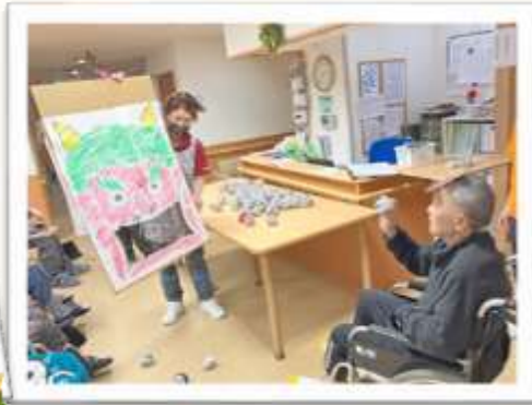
鬼は一そと、福は一うち みんなで豆まきをしました！