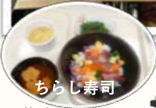
ちらし寿司 美味しかったわ♡