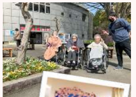
お花見に行ってきました🌸 桜はまだ5分咲きでしたが、ここ最近では気持ちの良いお天気で、最高のお出かけ日和でした♡